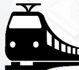
Железнодорожные пути необщего пользования