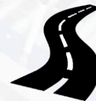
Дорожная инфраструктура (автомобильные дороги)